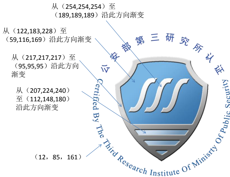
图 2: 标志的色系选取