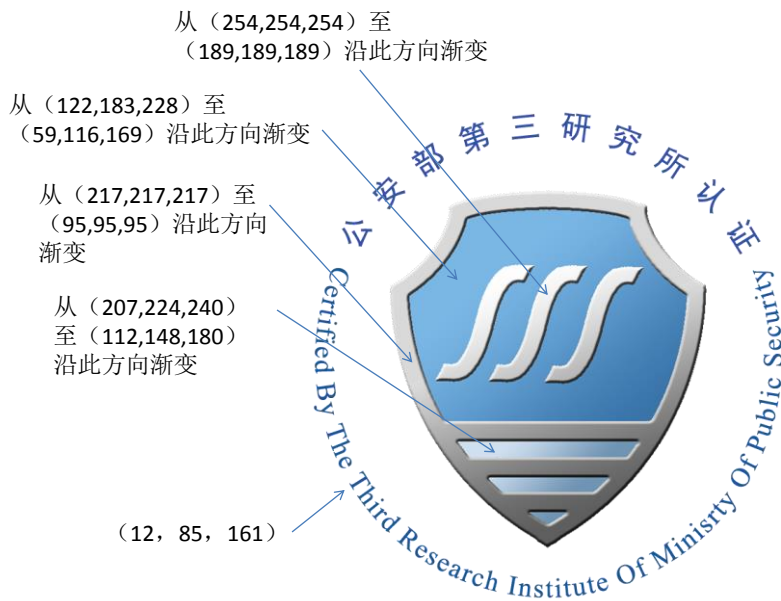
图 2: 标志的色系选取